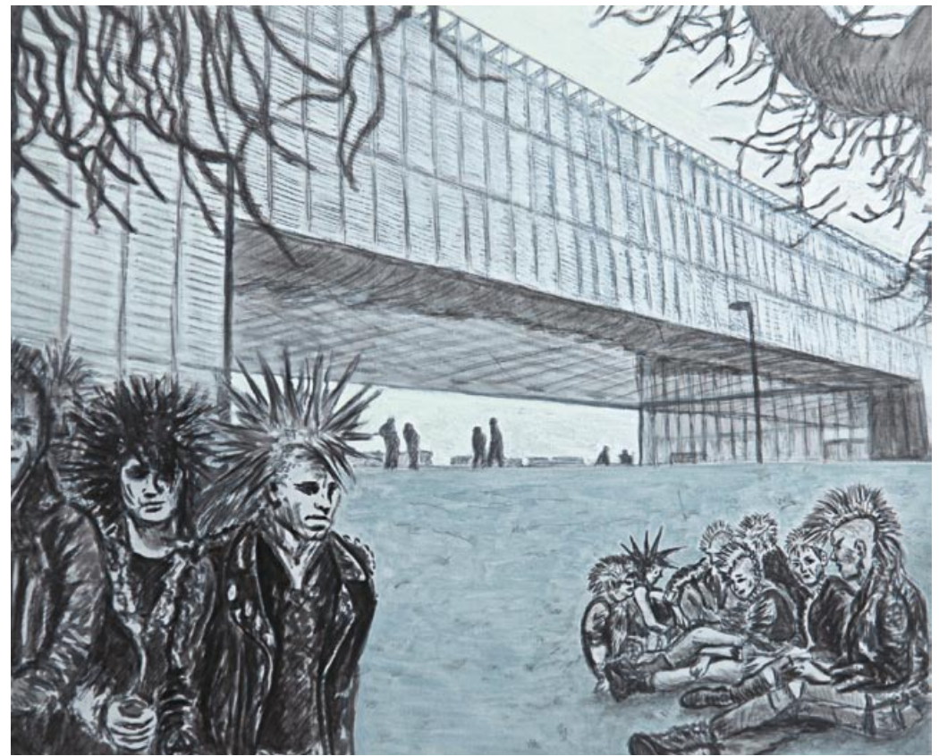
F. A. Obojes a.d. Serie „Stadtgeschichten“ 2009 Acryl auf MDF 30 x 37 cm