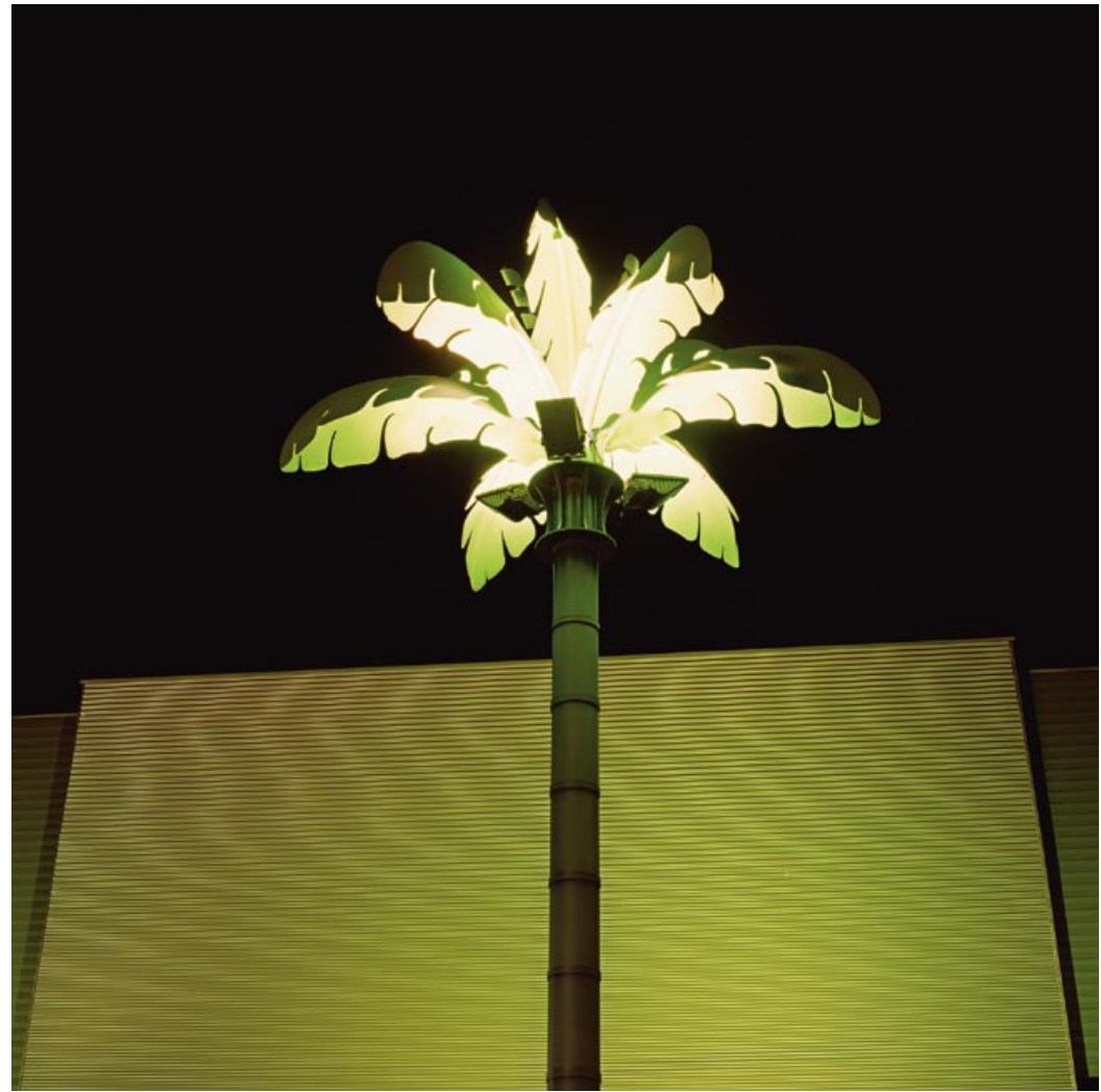
Anton Kehrer aus dem Photozyklus „Linz“ / Serie „Suburbia“ Cineplexx Linz / Prinz Eugen Straße C-Print, 40 x 40 cm, 2007