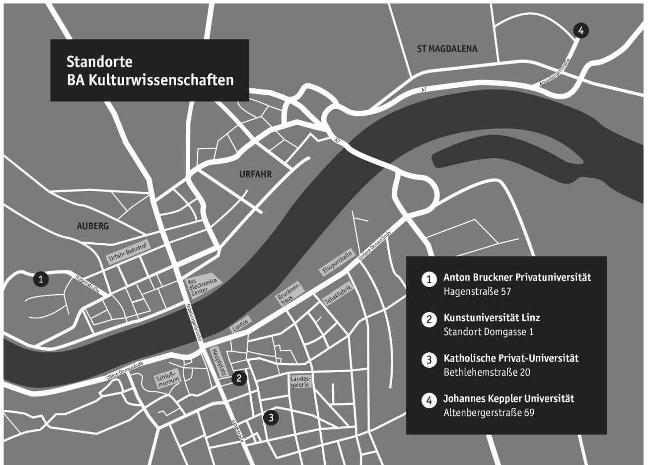
Lageplan Partneruniversitäten Studienstandort Linz