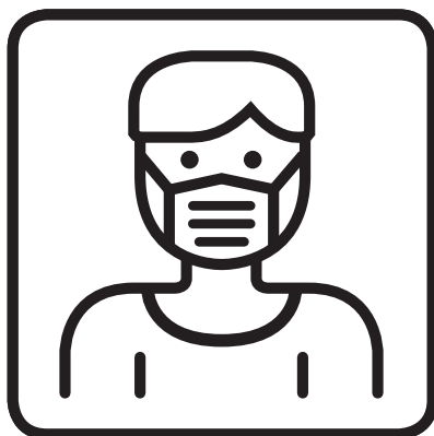
FFP2-Maske tragen Wear FFP2 mask