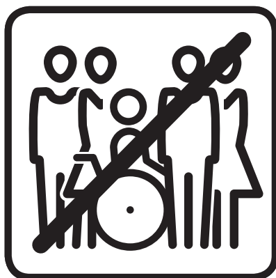
Enge Kontakte meiden Avoid close contacts