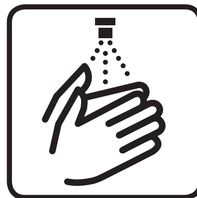
Hände desinfizieren Desinfect hands

Weitere Informationen: Further information: